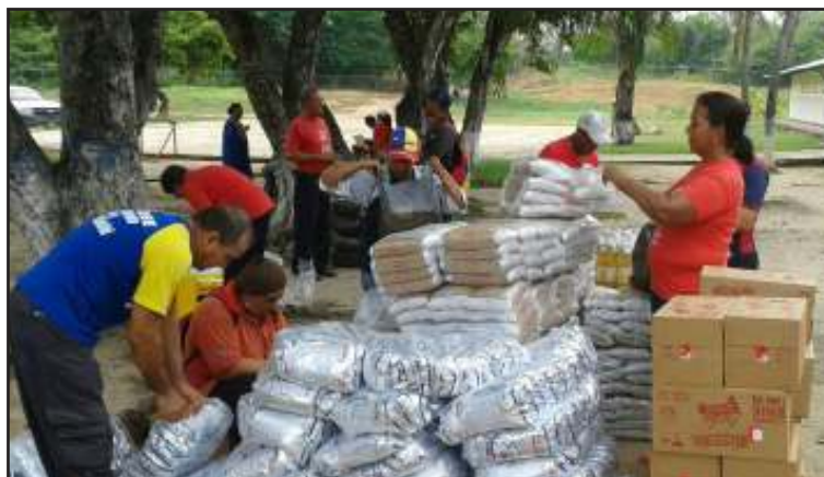
Familias indígenas de la zona agradecen el apoyo permanente del Estado.

La Ministra Aloha Núñez, Autoridad Única de este plan, manifestó que el Gobierno Bolivariano busca garantizar la distribución de alimentos a precios justos para los hermanos indígenas, quienes también han sido víctimas de la guerra económica no convencional. “Estas son estrategias para defender y apoyar a nuestros indígenas de los reiterados ataques que vivimos por parte de la derecha venezolana, las misiones sociales no se de-