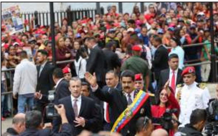
El Presidente Maduro fue recibido con mucho amor por el pueblo.

El poder popular acompañó al Primer Mandatario Nacional en su mensaje anual