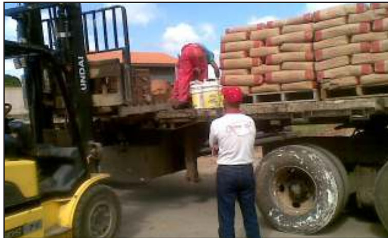
El Ministerio envió materiales de construcción a la comunidad.

“Nos trasladamos vía terrestre por más de 4 horas a Camurica, es una comunidad de difícil acceso pero para eso está la revolución, para llegar hasta el último rincón de la patria; nuestra meta es culminar estas viviendas por lo que enviamos sacos de cemento y pego, galones de pintura, cajetines, rollos de cables eléctricos, puertas y cerámicas; esta obra presenta un 40 por ciento de avance gracias al apoyo que nos ha brindado el poder popular organizado en su incorporación a la ejecución de