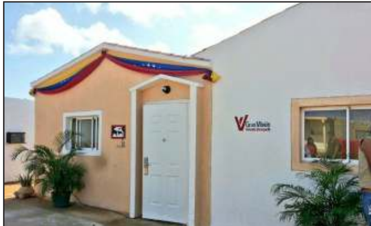
Las viviendas fueron construidas con el apoyo de consejos comunales.

La Viceministra para el Hábitat, Tierras y Desarrollo Comunal con Identidad para los Pueblos Indígenas, Indira Fernández, encabezó la entrega de las viviendas junto a