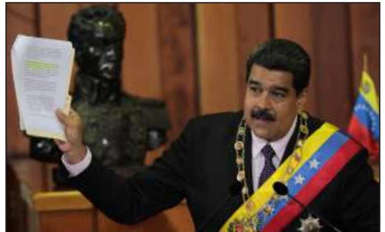
En su mensaje, ofreció detalles de su gestión en el año 2016.

El pasado 15 de enero, el presidente de la República, Nicolás Maduro, en la presentación de su mensaje anual a la nación, insistió en su llamado al diálogo nacional -al que ha invitado en diversas ocasiones a la oposición política- y lamentó la conducta conflictiva de la derecha venezolana, que por decisión de su dirigencia ha llevado a la nulidad a la Asamblea Nacional (AN) por desacato de las sentencias del