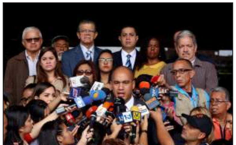
El Bloque de la Patria declaró inconstitucional la Junta Directiva de la AN.

Rodríguez recordó que hasta que no se desincorporen a los diputados del estado Amazonas, que ocupan curules al margen de la ley y la derecha parlamentaria desista de utilizar contra el Presidente Nicolás Maduro, una figura que no existe en la Carta Magna, como es el juicio político, la cámara continuará en desacato y ninguno de los actos que realicen serán válidos.