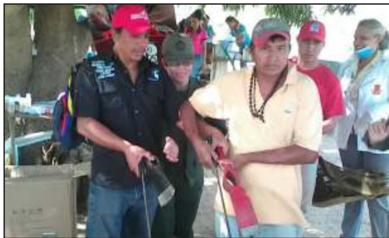
Indígenas de la zona fueron atendidos por la revolución bolivariana.

munidad indígena se le hizo entrega de kits agrícolas, con el objeto de fortalecer sus conucos en apoyo a la economía comunal.