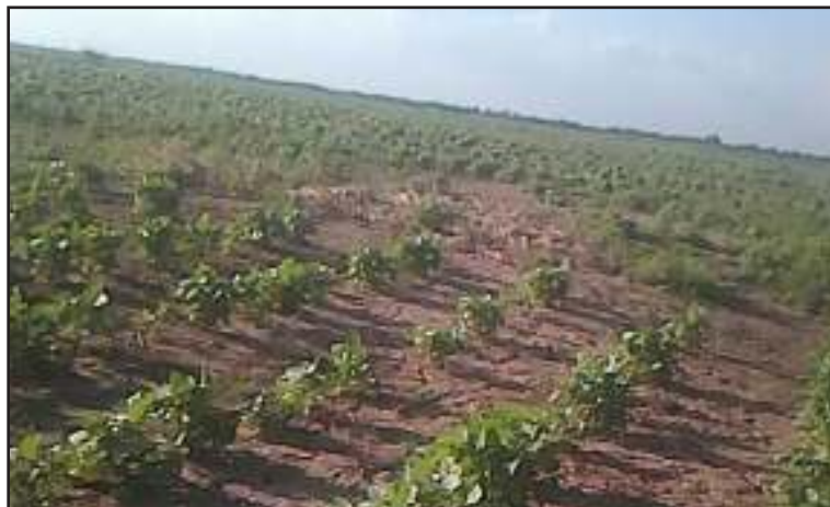
Familias indígenas recibirán caraotas y frijoles para su dieta diaria.