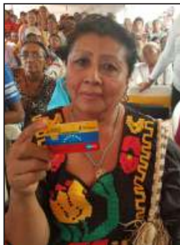
Pueblo Wayuu beneficiado.

de esta jornada realizada en el marco del Plan Nacional para la Erradicación de la Pobreza Extrema. “Entregamos 1442 tarjetas de Hogares de la Patria y 408 tarjetas de la Gran Misión En Amor Mayor; estamos garantizándole a cada jefe y jefa de familia un ingreso mensual de 50 mil bolívares, como parte de las medidas económicas asumidas por el presidente Nicolás Maduro para proteger al pueblo más necesitado; sabemos que aún existen muchos hogares a los que no hemos llegado, pero todo el Gobierno Bolivariano seguirá desplegado, sin descanso, para incorporar a nuestros pueblos indígenas en las misiones sociales porque ese fue