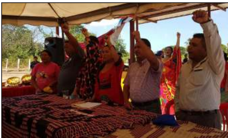
Autoridades del Estado acompañaron a la Ministra en la inauguración.

“Los pueblos indígenas hemos sido los grandes protagonistas de esta revolución; con este proyecto ratificamos que hemos sido incluidos como nunca antes pues esta bloquera fue levantada por nosotros mismos con apoyo del Gobierno Bolivariano; saber que con nuestros bloques se construirán grandes obras para el bienestar de nuestro municipio nos llena de satisfacción y a la vez de mucho compromiso porque debemos dar el ejemplo de que somos un pueblo indígena trabajador”, expresó la indígena Wayuu, quien manifestó en nombre de toda su comunidad el agradecimiento al Presidente por su eterno apoyo a la Guajira.