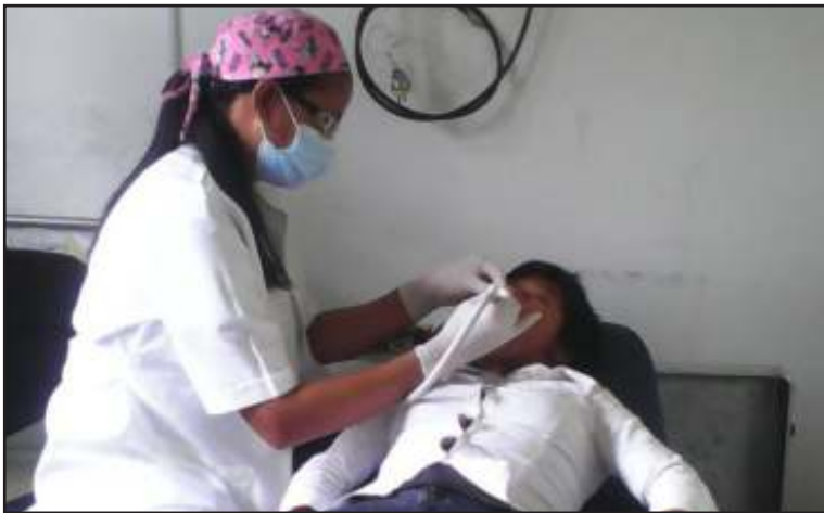
A los niños se les hizo limpieza general de manera gratuita.

Familias del sector le dieron las gracias a la ministra de Pueblos Indígenas Aloha Núñez por su apoyo consecuente