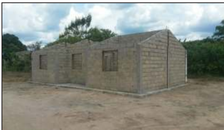
Las viviendas fueron inspeccionadas junto al poder popular.

“Las viviendas se encuentran en un 55 por ciento de avance y con estos materiales le daremos