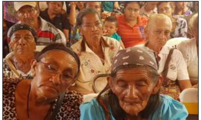
Estas asignaciones forman parte de las políticas sociales de la revolución.

Como una muestra de inclusión social, más de 1800 indígenas Wayuu y Añu del municipio Santa Rita en el estado Zulia recibieron de manos de la ministra de Pueblos Indígenas Aloha Núñez la asignación de tarjetas de la Gran Misión Hogares de la Patria y de la Gran Misión En Amor Mayor.