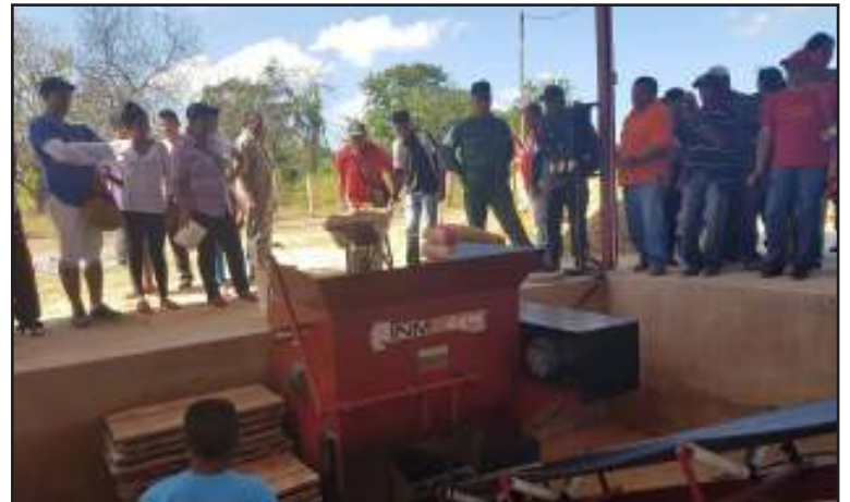
“Los Sueños del Comandante Chávez” representa un logro del pueblo.