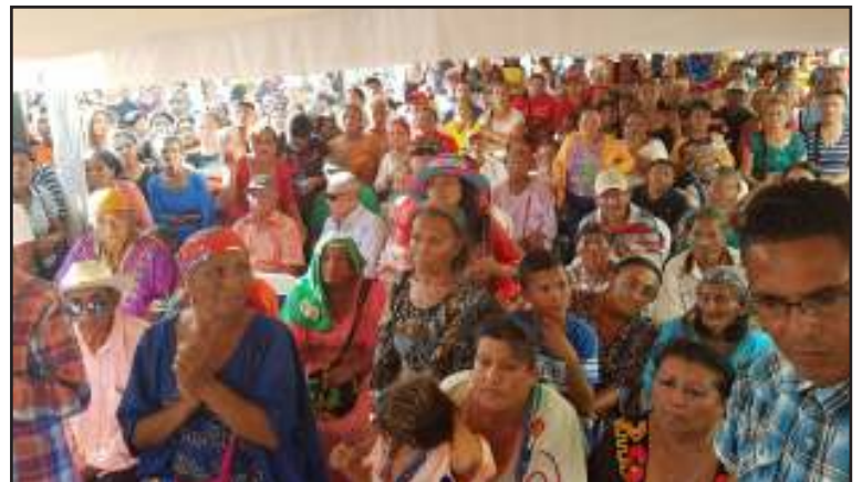
Indígenas Wayuu y Añu le dieron las gracias al Presidente Nicolás Maduro.