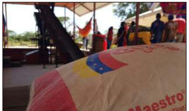
Esta bloquera fortalecerá los proyectos de la GMVV en el municipio.