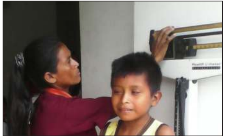
El Sistema de Misiones se hizo presente en la jornada médica.

Más de 130 indígenas Yukpa de la comunidad “Toromo” ubicada en el municipio Machiques de Perijá del estado Zulia, fueron atendidos a través de una jornada de salud integral que se realizó gracias al enlace interinstitucional del Ministerio del Poder Popular para los Pueblos Indígenas con el Sistema de Misiones y Grandes Misiones, así lo informó Ismelda Arbeláez, trabajadora de la Misión Guaicaiuro en el territorio comunal Sierra