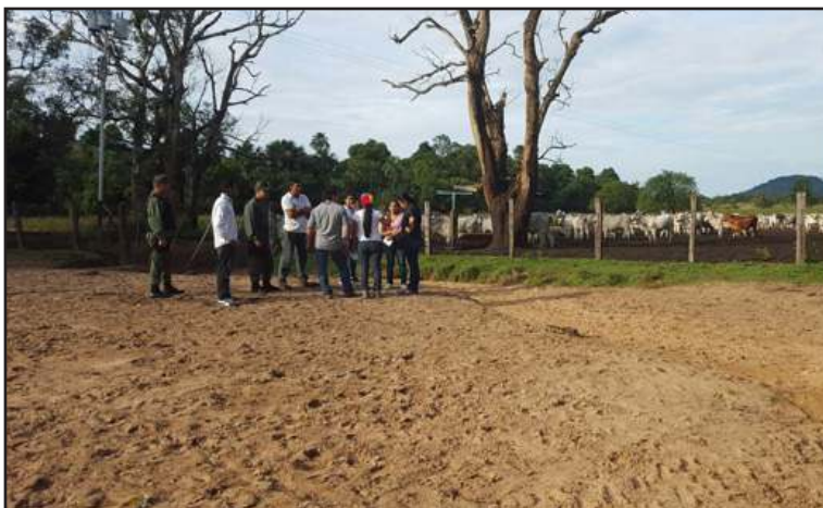
El Minppi ha respaldado la producción en las comunidades indígenas.