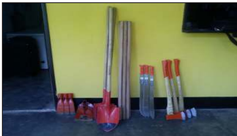
Productores de la comunidad agradecieron este donativo.

pueblo Pemón, destacó que estos kits eran necesarios para seguir avanzando con su plan de siembra. "Nosotros tenemos nuestros conucos y allí sembramos muchos alimentos de gran calidad. Recibi-