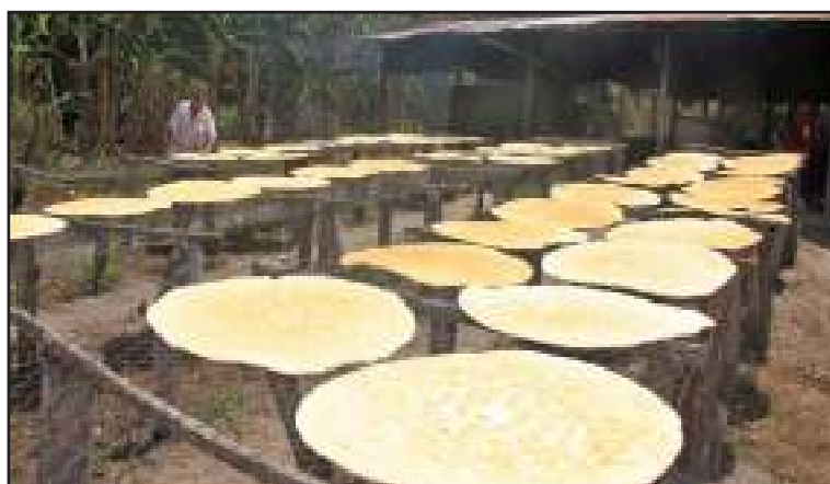
El casabe y el mañoco son alimentos típicos de los pueblos indígenas.

El indígena Bautista Vera, en representación de esta comunidad, manifestó que no sólo producirán casabe sino además