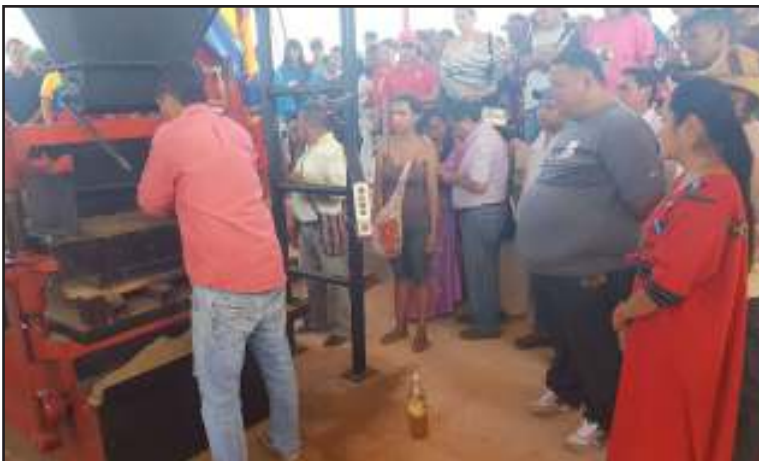
Esta bloquera estará a cargo del poder popular indígena Wayuu.

4 mil bloques diarios producirá esta Empresa de Producción Socialista ubicada en la comunidad “El Tastu”