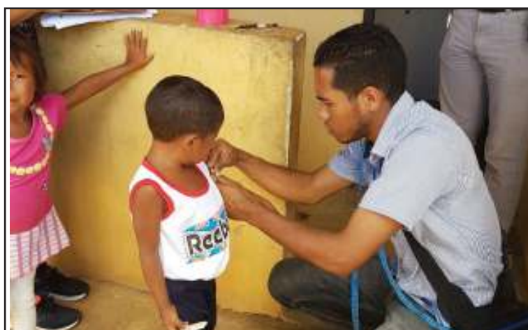
Las condiciones de salud también fueron evaluadas en esta jornada.