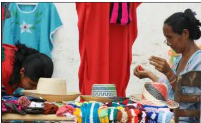
La institución ha apostado a la autosustentabilidad de las comunidades.

El 8 de enero el Ministerio del Poder Popular para los Pueblos Indígenas arribó a su décimo aniversario construyendo Patria para los Indios